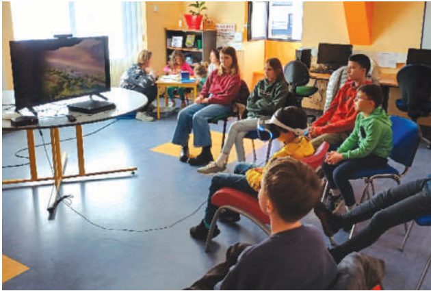
Survol de la ville de Paris dans la peau d'un aigle avec le Casque de Réalité Virtuelle.