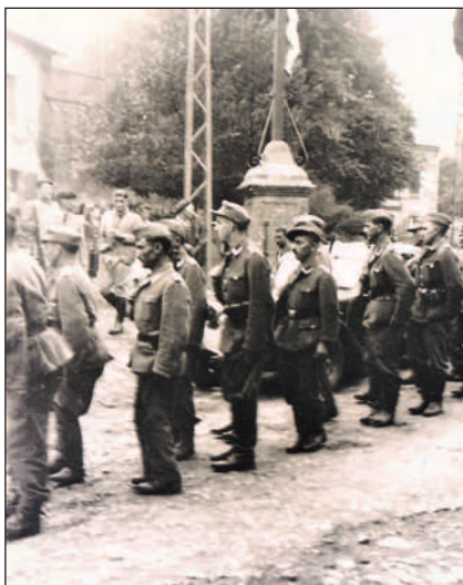
Soldats Russes à Arviou

N.B. Si parmi les lecteurs certains disposent de documents ou de souvenirs intéressants de cette époque concernant notre commune, nous les remercions de les faire connaître à la mairie.