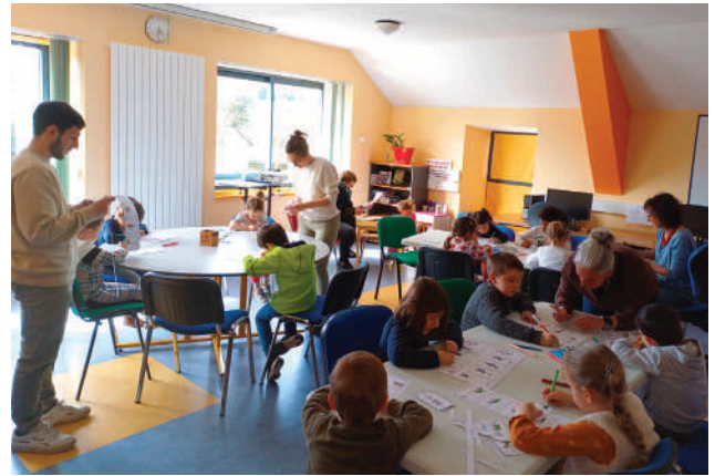
Activités avec les écoles suite aux projections dans le cadre du festival du court métrage.

De nombreux ateliers numériques régulièrement proposés pour tous les âges et tous publics à Arvieu ou délocalisés sur le territoire Pareloup-Lévezou (environ 200 en 2024) :